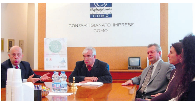
La presentazione della Onlus alla stampa

Presentata alla stampa in una conferenza venerdì scorso l'Associazione "Per un Sorriso" Onlus, costituita da Confartigianato Imprese, che raccoglierà le iniziative di solidarietà dell'imprenditoria artigiana, ovvero: la promozione e il sostegno di attività e di iniziative dirette alla ricerca scientifica di malattie congenite in genere, e che ha avviato la propria attività, nella sua prima uscita ufficiale in un evento che si è svolto ieri presso il Grand Hotel di Como e che ha visto coinvolte numerose personalità e autorità della politica, dell'economia e della società comasca, durante il quale, la Onlus, ha presentato una simpatica sfilata di moda di abbigliamento per bambini, grazie al prezioso contributo di Chicco Artsana SpA che ha offerto tutti i capi indossati dai piccoli